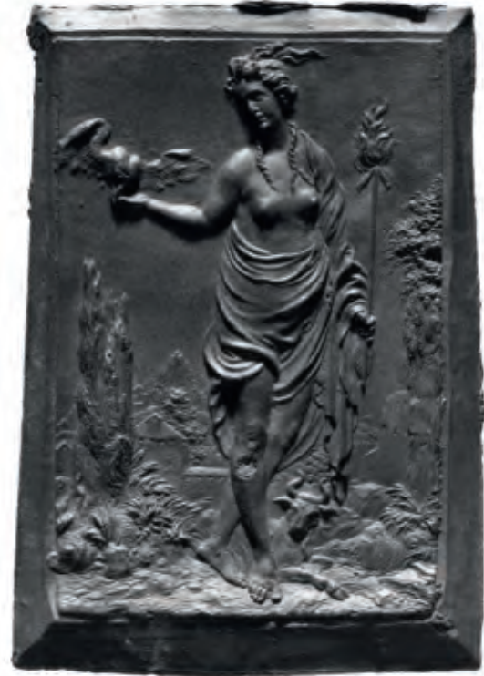
Abb. 3 Luxuria – die Unkeuschheit. Plakette aus der Reihe «Die sieben Hauptsünden» von Peter Flötner (um 1490–1546). Ihre Attribute sind ein brennender Pfeil, ein geflügeltes Herz und ein ruhender Stier zu ihren Füßen. Ein Exemplar befand sich vermutlich auch im Amerbach-Kabinett.

tonische Rahmung mit Himmelsloch und aus dem Mauerwerk hervorbrechendem Lorbeer. Über der Tür positionierte Pergo einen Blendgiebel in frühem Knorpelwerkstil mit einem akanthusartigen Blütenzapfen. Aufgrund der von Pergo verwendeten Attribute wurde die Allegorie bisher mit Verweis auf eine entsprechende Vorlage in Gabriel Rollenhagen's 1611/13 erschienenem Nucleus Emblematicum als Streben nach Gotteserkenntnis gedeutet – diese Interpretation der Frauenfigur als Tugendallegorie scheint der Aussage der Flötner'schen Vorlage zunächst diametral zu widersprechen. 2 Eine Erklärung findet sich erst im Zusammenspiel der Allegorie mit dem Bildprogramm der Schaufassade des Kunstschranks. Dargestellt ist dort der «Tod der Procris» nach Blättern von Rosso Fiorentino (1495–1540), der als Hofmaler für François 1 er in Fontainebleau tätig war (Abb. 4). 3