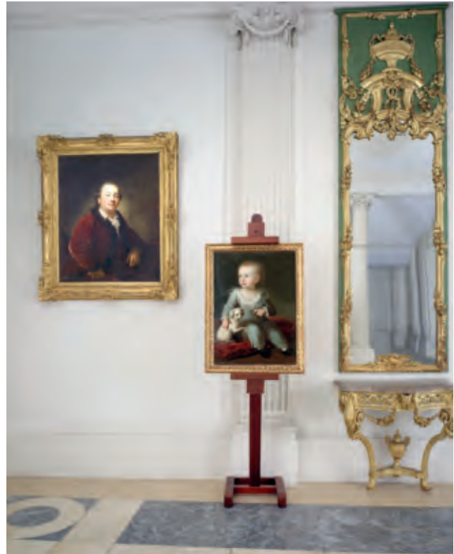
Abb. 4 Aktuelle Präsentation im Haus zum Kirschgarten.