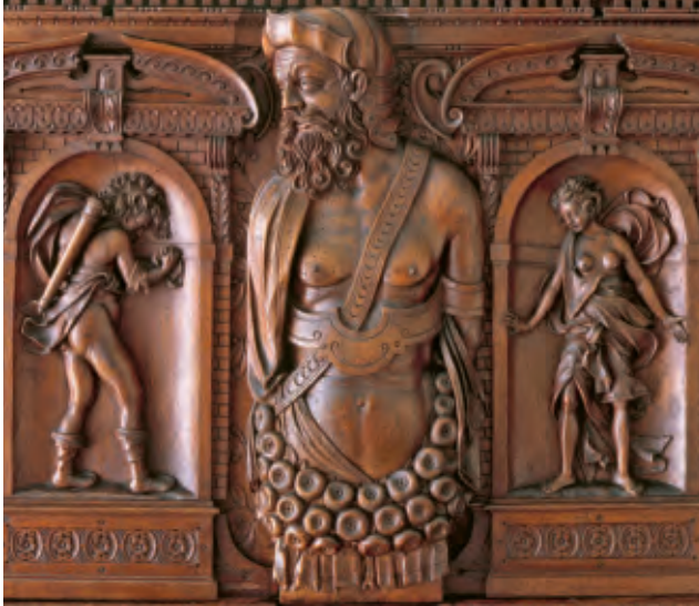
Abb. 4 Der «Tod der Procris». Reliefschnitzerei auf den Schranktüren nach Vorlagen von Rosso Fiorentino (1495–1540). Cephalus erkennt seine von ihm tödlich getroffene Gattin.

ihrem Gatten und versteckte sich im Gebüsch, um ihn des Ehebruchs zu überführen. Cephalus, ermüdet durch die Jagd, rief nach dem kühlenden Luftzug Aura, um Erfrischung zu erhalten. Als Procris sich nun in ihrem Versteck bemerkbar machte, hielt Cephalus das Rascheln im Gebüsch für das Geräusch eines Tieres und schleuderte seinen tödlichen Speer. Die beiden Reliefs am Sammlungsschrank zeigen den tragischen Höhepunkt des Mythos, als Cephalus seine getroffene Gattin erkennt und Procris in ungläubigem Schrecken ihren Tod nahen sieht.