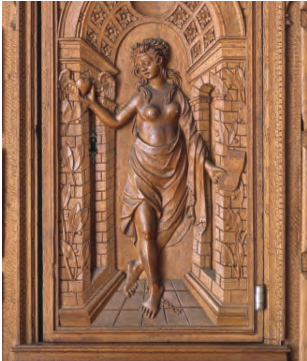
Abb. 2 Die zentrale Allegorie im Inneren des Kunstschranks mit den Attributen Buch, geflügeltes Herz und Fussfessel.

tonische Rahmung mit Himmelsloch und aus dem Mauerwerk hervorbrechendem Lorbeer. Über der Tür positionierte Pergo einen Blendgiebel in frühem Knorpelwerkstil mit einem akanthusartigen Blütenzapfen. Aufgrund der von Pergo verwendeten Attribute wurde die Allegorie bisher mit Verweis auf eine entsprechende Vorlage in Gabriel Rollenhagen's 1611/13 erschienenem Nucleus Emblematicum als Streben nach Gotteserkenntnis gedeutet – diese Interpretation der Frauenfigur als Tugendallegorie scheint der Aussage der Flötner'schen Vorlage zunächst diametral zu widersprechen. 2 Eine Erklärung findet sich erst im Zusammenspiel der Allegorie mit dem Bildprogramm der Schaufassade des Kunstschranks. Dargestellt ist dort der «Tod der Procris» nach Blättern von Rosso Fiorentino (1495–1540), der als Hofmaler für François 1 er in Fontainebleau tätig war (Abb. 4). 3