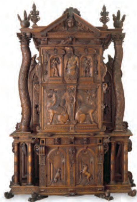
Abb. 1 Kunstschränk, dat. 1619 // Franz Pergo (um 1570–1629) zugeschrieben // Nussbaum // H. 241 cm, B. 170 cm, T. 68 cm // Inv. 1905.276.

Eher zufällig wurde nun in der Plakettensammlung des Historischen Museums auch die Vorlage für die Allegorie auf der zentralen Tür im Inneren des Kunstschränks entdeckt ( Abb. 2 und 3 ). Es handelt sich um eine «Luxuria» (Unkeuschheit) aus der Reihe «Die sieben Hauptsünden» des in Nürnberg tätigen Künstlers Peter Flötner (um 1490–1546), deren Attribute von dem mutmasslich ausführenden Bildschnitzer Franz Pergo (um 1570–1629) jedoch teilweise ausgetauscht wurden. Unverkennbar übereinstimmend auf Möbeltür und Bleiplakette ist die Frauenfigur in Schrittstellung mit entblösster Brust und einem geflügelten Herzen in der rechten Hand als Zeichen der Hingabe. Ein lose umgeschlungenes Tuch verhüllt ihren Körper nur notdürftig. Die eindeutig erotisch konnotierten Attribute des brennenden Pfeils in der linken Hand der Luxuria und den zu ihren Füßen ruhenden Stier ersetzte Pergo durch ein geöffnetes, dem Betrachter zugewandenes Buch und eine Fussfessel am rechten Bein. Anstelle eines Hintergrundes mit Baumstumpf, Gebäuden und Gebirgslandschaft erscheint bei Pergo eine architek-